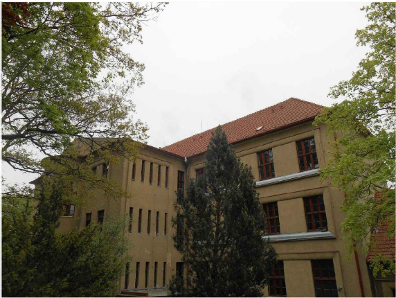
FOTO - STÁVAJÍCÍ STAV